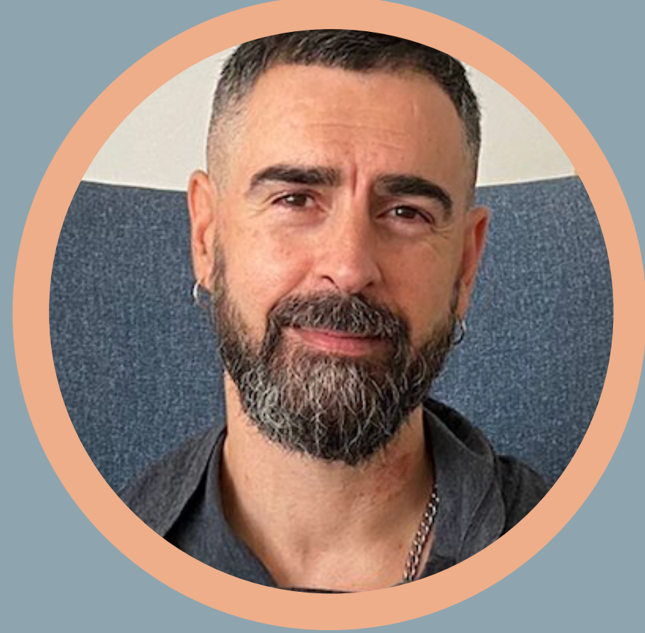
Imparte: Miguel Fuster