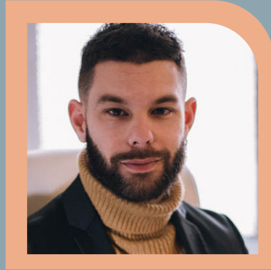
Imparte: Alejandro vera